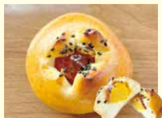
はちみつおさつパン 180円(税込)

柔らかな生地の中には、大きなさつまいも! 相性ばっちりのはちみつをかけちゃいました♡ おやつにもおすすめです♪