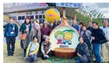
「美菜恋来屋」(JAあわじ島他)