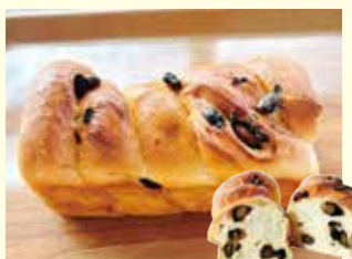
丹波の黒豆わんろふ 1本380円(税込)

ふわふわ柔らかい生地に、ほのかな甘さの黒豆がたっぷり! 黒豆の風味が口いっぱいに広がります♡