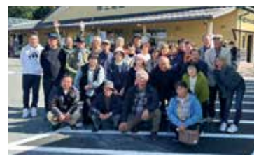
「味土里館」(JA丹波ささやま)

各地の特色ある直売所を視察し、店頭掲示や運営の工夫など、今後のときめき水都市に活かせる多くの学びを得ることができました。