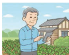
【リアルタイムで情報を受信】

県域JAでは、組合員の利便性を高め、営農指導員がより現場に向き合える時間を確保するため、購買や販売、情報発信、農作業管理のデジタル化について検討を進めています。デジタル化により、病害虫情報や出荷明細など、これまで紙で確認していた内容を、いつでもどこでも閲覧できるようになります。また、農作業管理をスマホやタブレットで行えるようにすることで、JAとの情報共有がスムーズになり、より相談しやすい営農支援につながります。