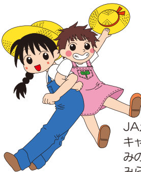
JAえひめ未来 キャラクター みのりちゃん みらいちゃん