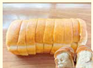
クリームサンド 380円(税込)

柔らかな生地の中には、大きなさつまいも! 相性ばっちりのはちみつをかけちゃいました♡ おやつにもおすすめです♪