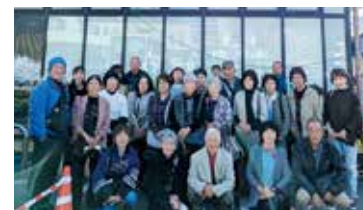
「とれたて元気市 広島店」(JA全農広島)